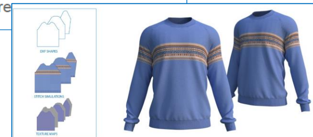
e.g. 3D render made with V stitcher by Browzwear